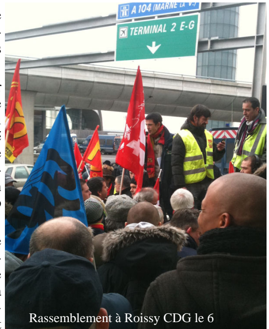
Rassemblement à Roissy CDG le 6

La FEETS FO rappelle que c'est la libéralisation du secteur, les privatisations, le « dumping-social » et la « low-costisation », la précarisation des emplois au profit des actionnaires et du patronat, les refus de négociation par ce dernier, etc, qui sont responsables des problèmes générateurs de conflits. Voter une loi pour casser la grève et donner les moyens au patronat de pourchasser les grévistes est donc une attaque directe contre les salariés et contre leurs droits fondamentaux. C'est aussi un artifice pour tenter de masquer les sources de conflits sans les résoudre.